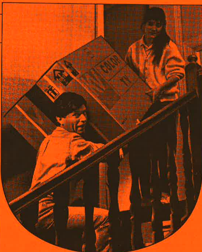
Doyle Dane Bernbach 7

Breng hem zeker een bezoek wanneer u ooit geld wil lenen. Hij zorgt ervoor dat de last van uw lening heel licht om dragen wordt.